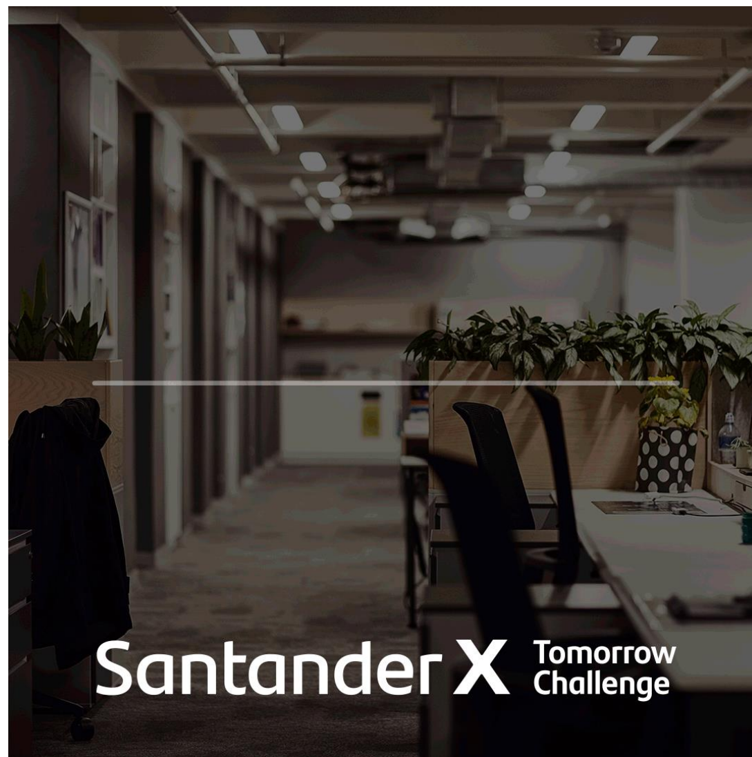
Banner animado: ver en modo presentación